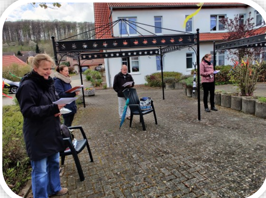
Unser kleiner Chor